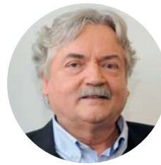
REDAKTION WILFRIED BOMMERT

Sozialwissenschaftlerin, Fachexpertin für Ernährungssouveränität, Bochum